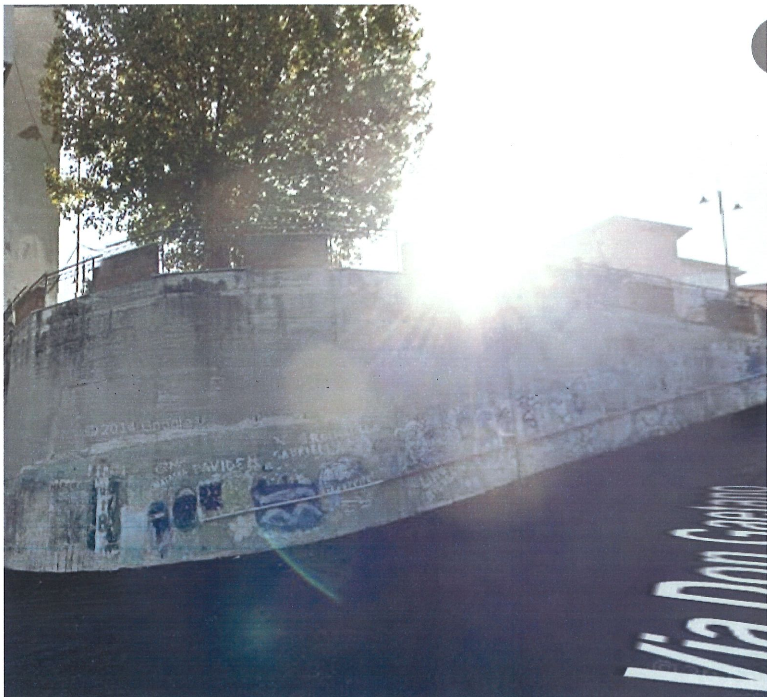
PROSPETTO MURO VIA DON GAETANO