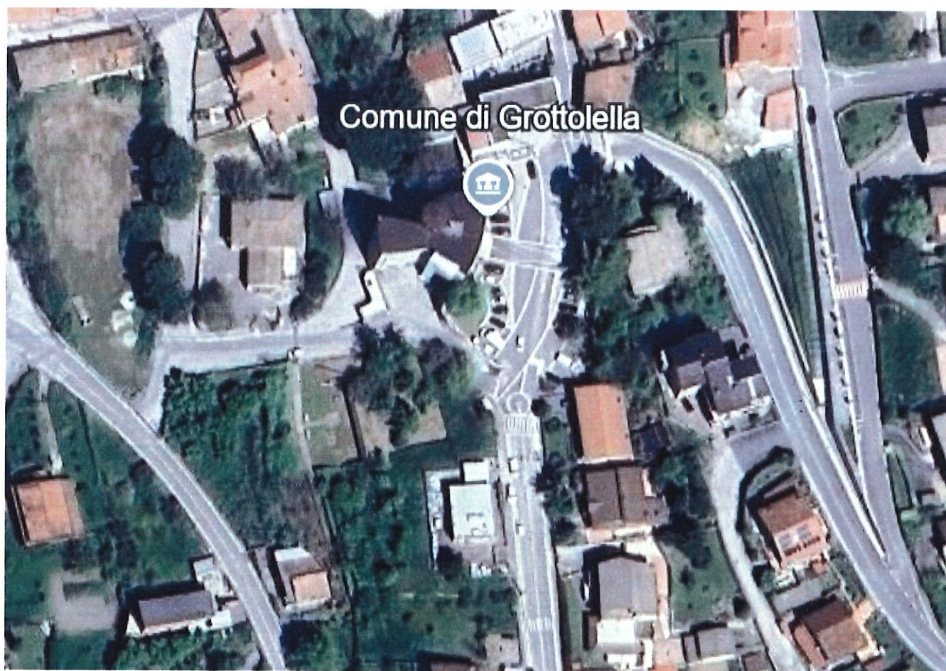
ORTOFOTO MURO VIA DON GAETANO - PIAZZA MUNICIPIO