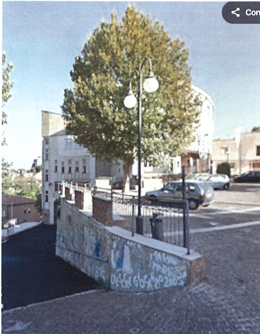
PROSPETTO MURO VIA DON GAETANO