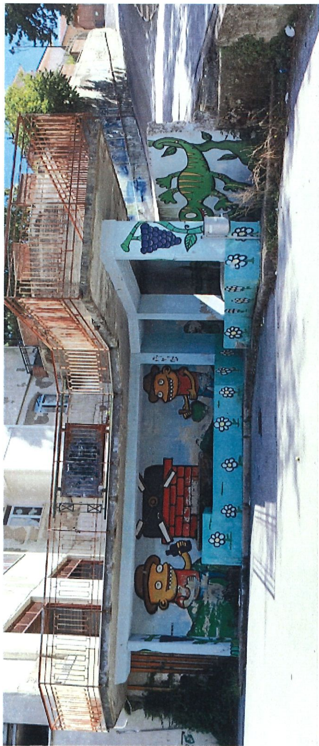
FONTEGGIA ESISTENTE FONTANINO COMUNALE